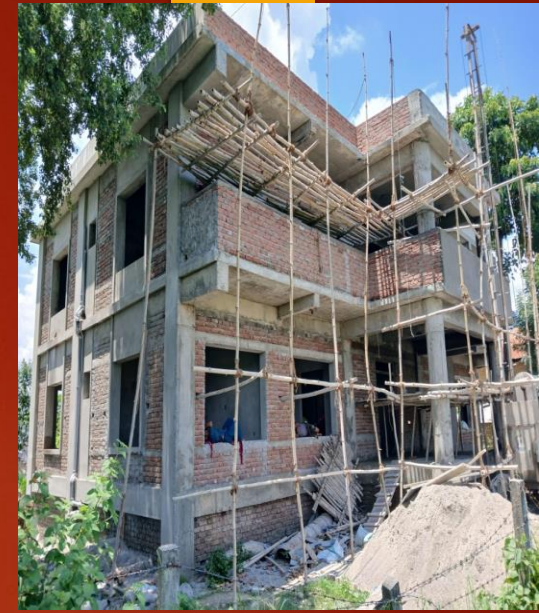
निर्माणाधिन वडा नं. ३ को कार्यालय