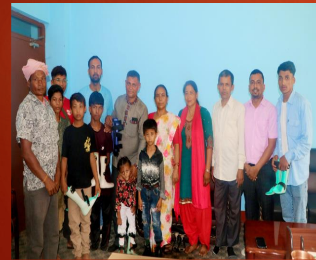
अपाङ्गता बालबालिकाहरुलाई सहायक सामग्री प्रदान