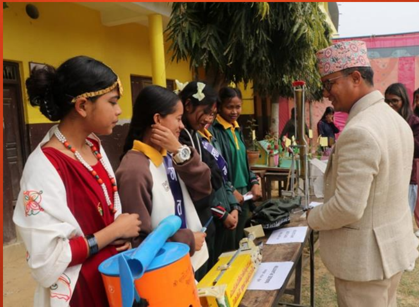
विद्यालयमा शैक्षिक प्रदर्शनी