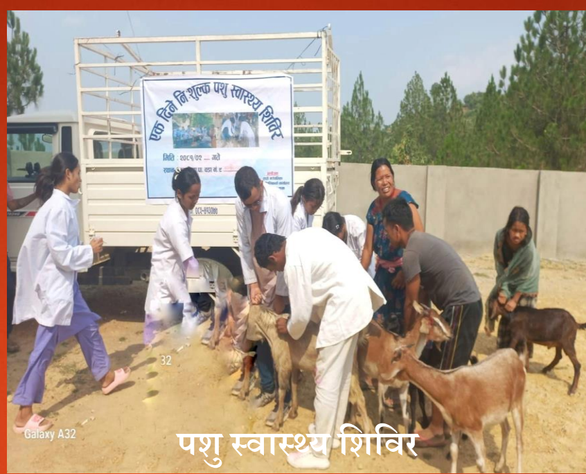
पशु स्वास्थ्य शिविर