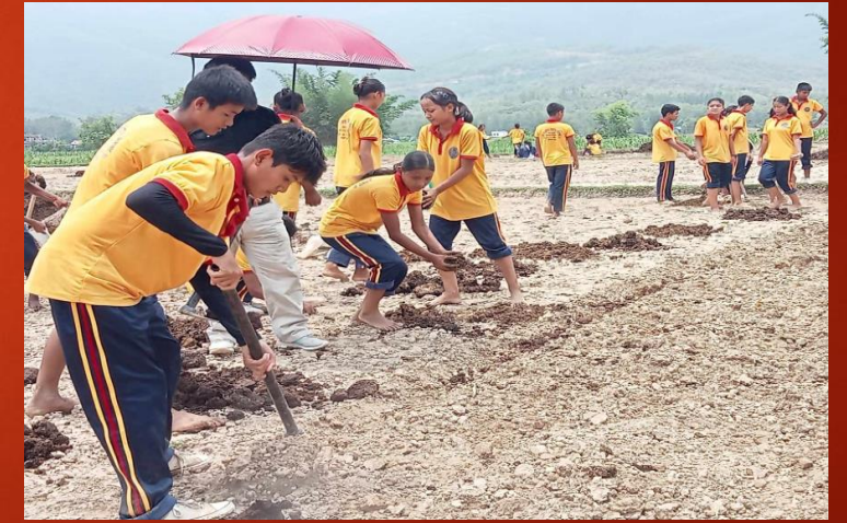
IPF कार्यक्रम अन्तर्गत विद्यार्थीहरूले सामूहिक रुपमा बेसार खेती गर्दै