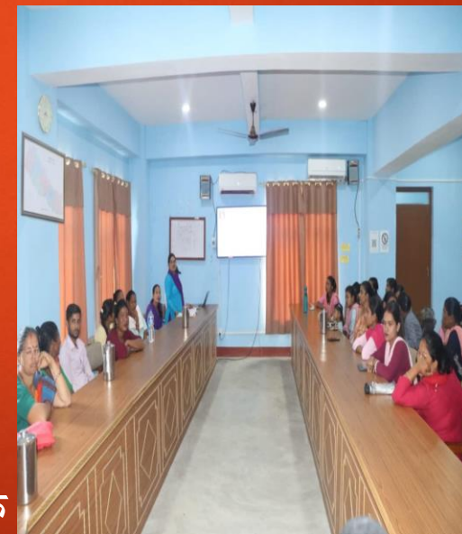
पुनः श्रम स्वीकृति प्राप्ती पछिका तस्विरहरु तथा रोजगार संम्वाद मञ्च मार्फत रोजगारी सम्बन्धी छलफल