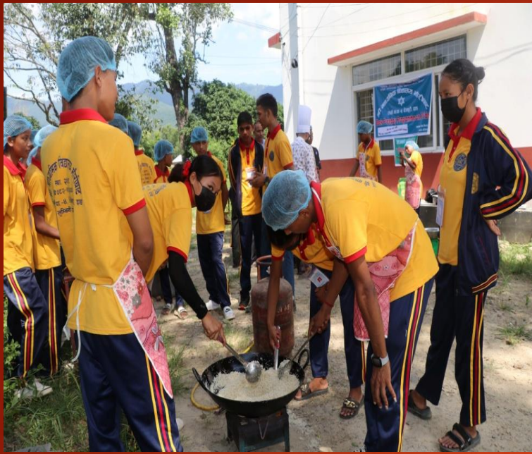
BOOK FREE FRIDAY