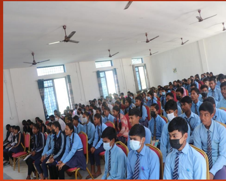
अक्षर सुधार कार्यक्रम