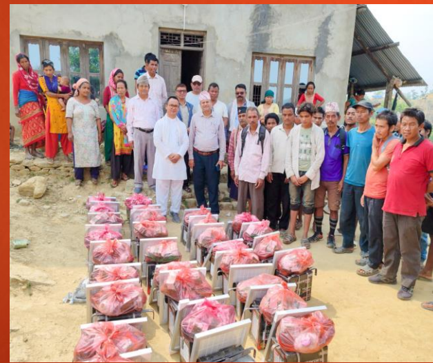
दुर्गमका विपन्न ४३ परिवारलाई निःशुल्क सोलार वितरण