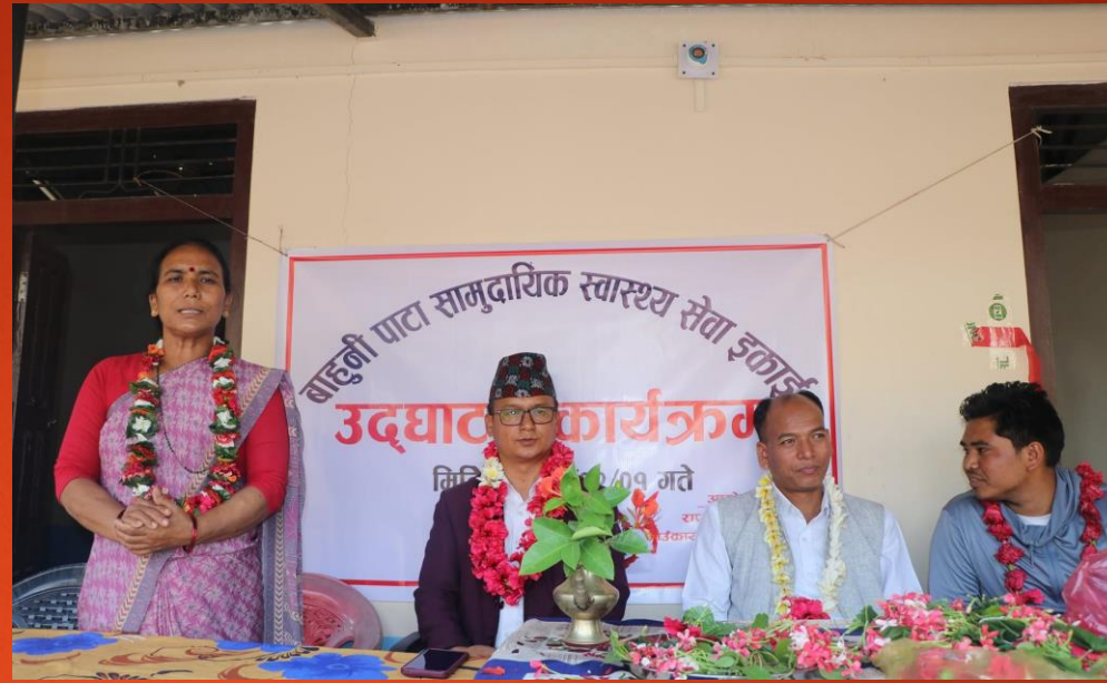
सामुदायिक स्वास्थ्य ईकाई भवनको प्रदेश संसद थारुद्वारा उद्घाटन