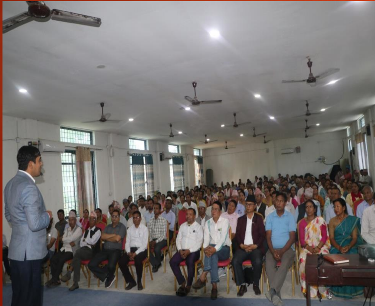
शिक्षक कर्मचारी उत्प्रेरणात्मक कार्यक्रम