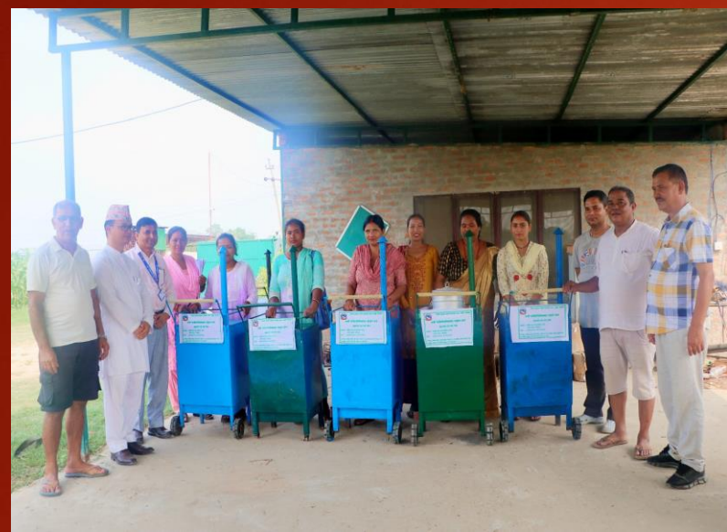
मकै पोलने तालिम सँगै प्रविधि हस्तान्तरण