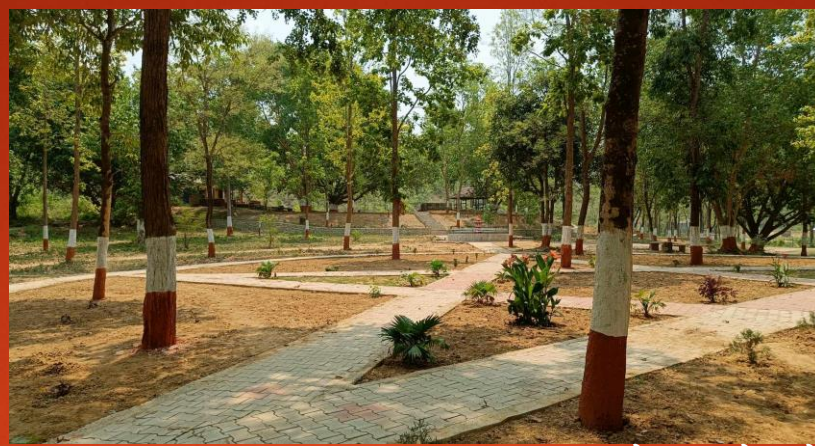
रोजगार सेवा केन्द्रबाट भएका कामहरु