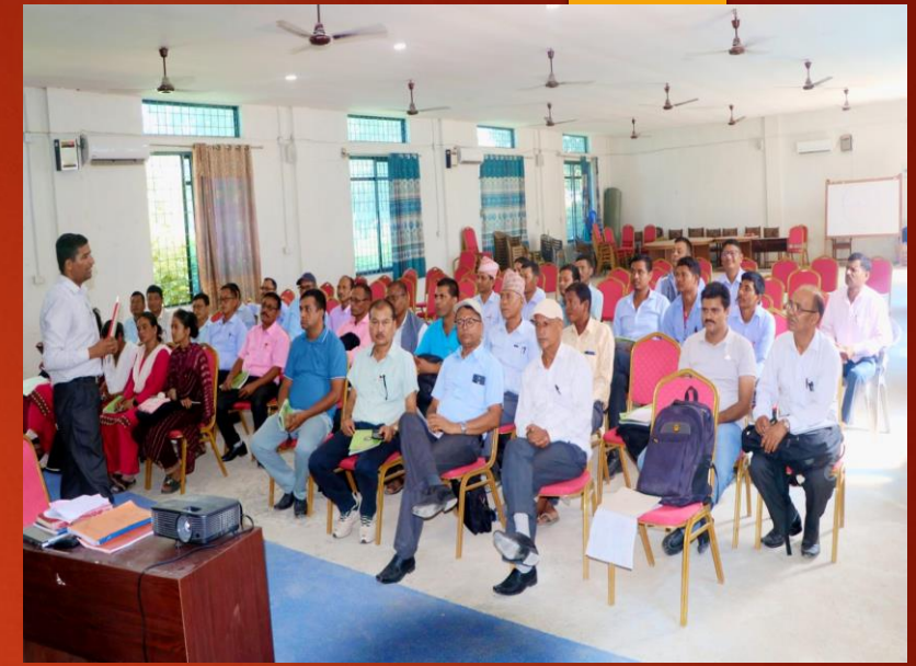
विद्यालय कर्मचारीहरूका लागि खरिद तथा लेखा व्यवस्थापन सम्बन्धी तालिम