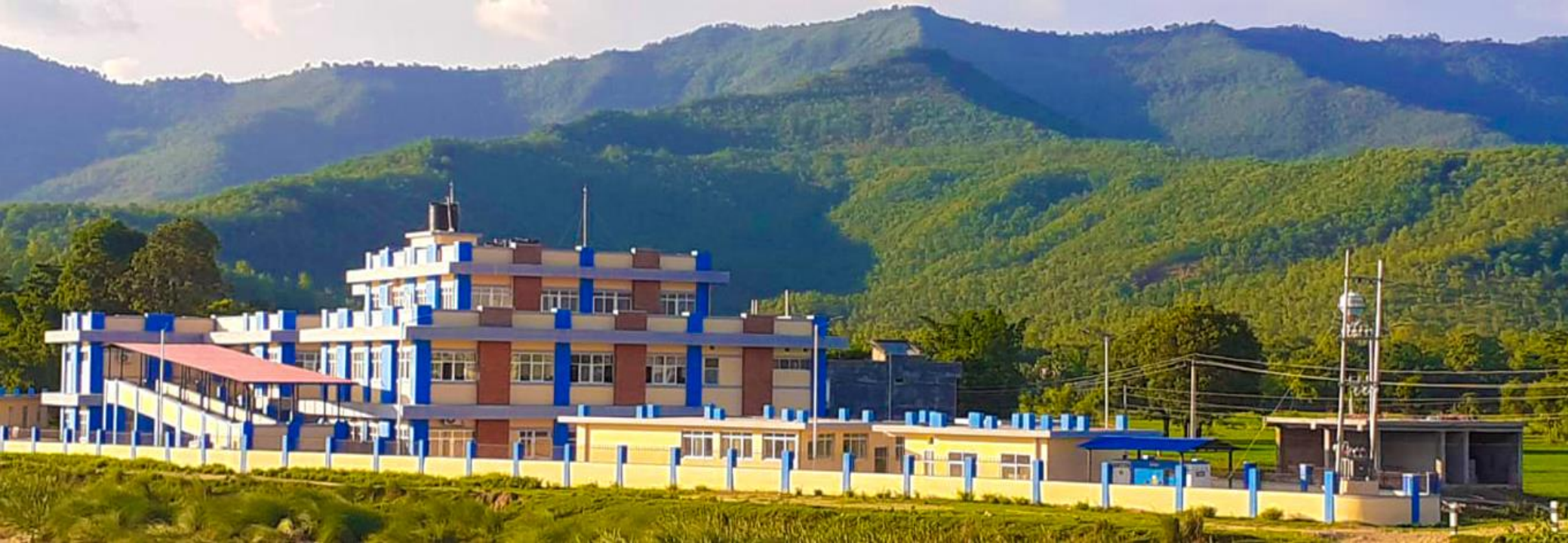
निर्माण सम्पन्न आधारभुत अस्पताल