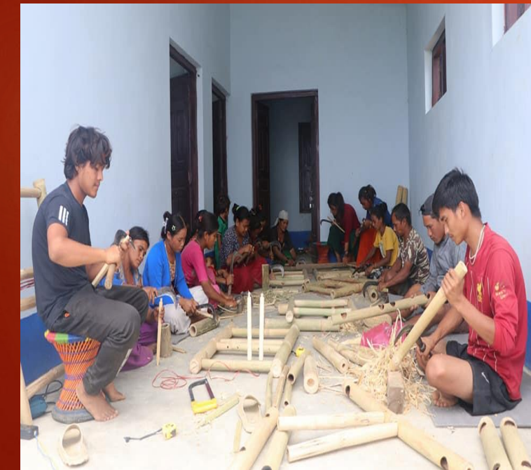
बासँबाट फर्निचर बनाउने तालिम