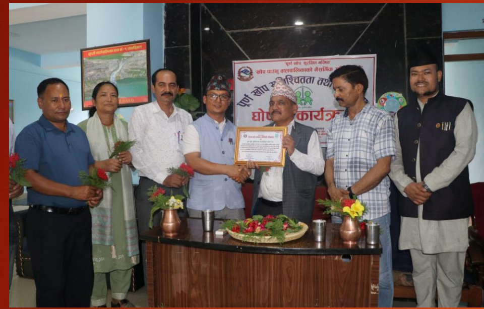
पूर्ण खोप सुनिश्चितता तथा दिगोपना गाउँपालिका घोषणा