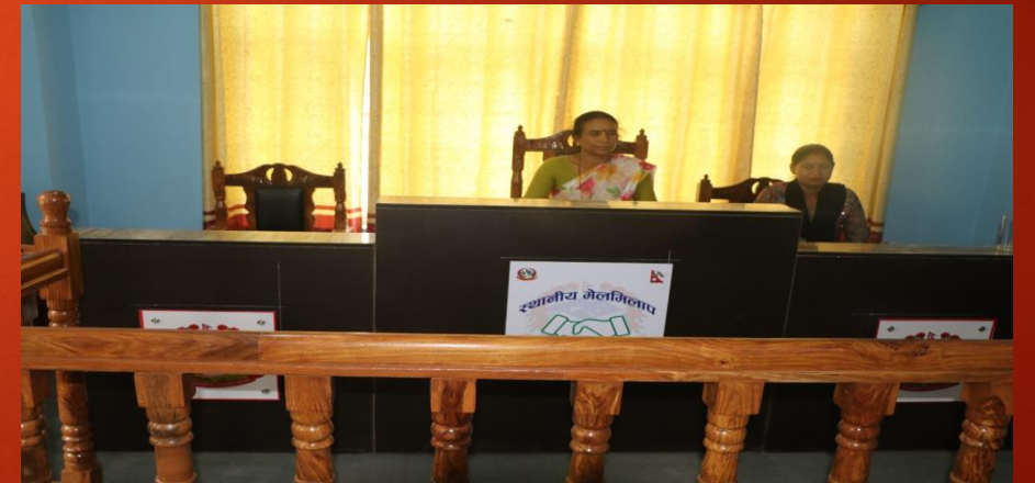
स्थानीय मेलमिलाप कक्ष