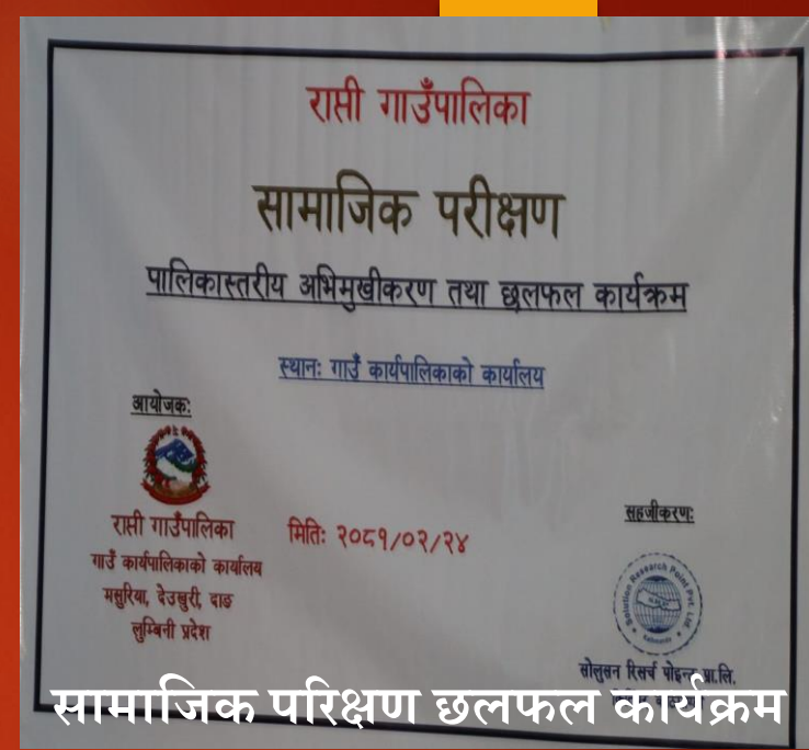
सामाजिक परिक्षण छलफल कार्यक्रम