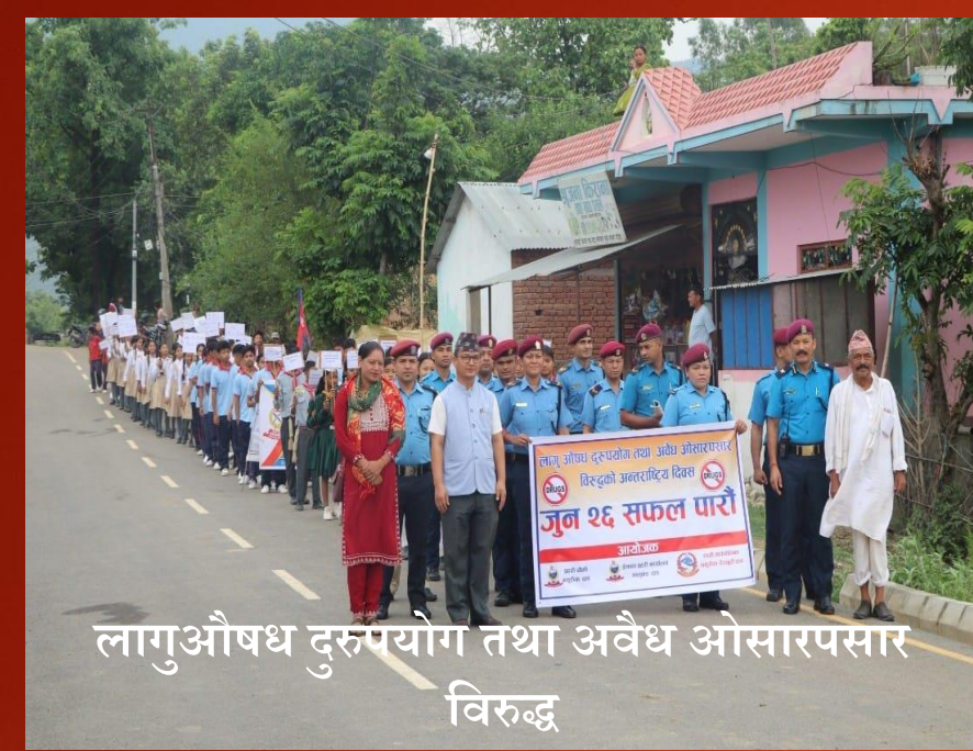
लागु औषध दुरुपयोग तथा अवैध ओसारपसार विरुद्ध